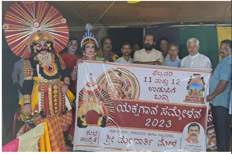
ಶಿರಿಯಾರದಲ್ಲಿ ಮಂದಾರ್ತಿ ಮೇಳದ ಚೌಕಿಯಲ್ಲಿ ಯಕ್ಷಗಾನ ಸಮ್ಮೇಳನದ ಬ್ಯಾನರ್ ಅನಾವರಣ

ಡಾ. ಜೋಶಿ: ಕನ್ನಡ ಸಾಹಿತ್ಯ ಸಮ್ಮೇಳನದಲ್ಲಿ ಯಕ್ಷಗಾನ ಕವಿಗಳನ್ನು ಸೇರಿಸುವುದು ಬೇಡಿಕೆಯಾಗಬಾರದು. ಅವರಿಗೆ ಬೇಕೆಂದರೆ ಪರಿಗಣಿಸಲಿ. ಕನ್ನಡ ಸಾಹಿತ್ಯದ ಅಧ್ಯಯನ ಪರಿಪೂರ್ಣವಾಗಬೇಕಾ? ಅದರಲ್ಲಿ ಪ್ರಸಂಗ ಸಾಹಿತ್ಯವನ್ನು ಅರ್ಥಗಾರಿಕೆಯನ್ನು ತೆಗೆದುಕೊಳ್ಳಲಿ. ಬೇಡಿಕೆ ಎಂಬ ಪದವನ್ನು ಯಕ್ಷಗಾನದವರು ಬಳಸಲೇ ಬಾರದು. ಕಳೆದ 50 ವರ್ಷಗಳಲ್ಲಿ 1972ನೇ ಇಸವಿಯಲ್ಲಿ ಕಾರ್ಕಳದಲ್ಲಿ ನಡೆದ ಸಾಹಿತ್ಯ ಸಮ್ಮೇಳನದಿಂದ ಹಿಡಿದು ಇವತ್ತಿನವರೆಗೂ ಜಿಲ್ಲಾ ಮಟ್ಟದ ಸಾಹಿತ್ಯ ಸಮ್ಮೇಳನದಲ್ಲಿ ಯಕ್ಷಗಾನವನ್ನು ಪರಿಗಣಿಸಿದ್ದಾರೆಯೇ. ಇದರ ಉಲ್ಲೇಖವನ್ನು ಆರ್ ನರಸಿಂಹಾಚಾರ್ ಕನ್ನಡ ಸಾಹಿತ್ಯ ಚರಿತ್ರೆ ಕವಿಚರಿತೆಯಲ್ಲಿ ಹೇಳಿದ್ದಾರೆ. ಬೆಂಗಳೂರು ವಿಶ್ವವಿದ್ಯಾನಿಲಯದ ಸಾಹಿತ್ಯ ಚರಿತ್ರೆಯಲ್ಲಿ ಯಕ್ಷಗಾನದ ಬಗ್ಗೆ ವಿಸ್ತಾರವಾದ ಮಾಹಿತಿ ಇದೆ. ಎನ್ ಎಸ್ ಲಕ್ಷ್ಮೀ ನಾರಾಭಟ್ ರವರ ಸಂಕ್ಷಿಪ್ತ ಸಾಹಿತ್ಯ ಚರಿತ್ರೆ ಕೃತಿಯಲ್ಲಿಯೂ ಇದೆ. ಇದೊಂದು ಜನಪ್ರಿಯವಾದ ಭಾವನೆ.